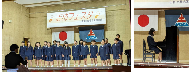
志柿フェスタで4年生が believe を合唱しました。6年生がピアノの演奏をしました。

さて、10月下旬から11月にかけて東っ子の活躍の場が校外へ広がりました。地域の皆様にGTや見守り隊等でいつもお世話になっておりますので、学校としても地域貢献、地域への発信を心がけていきたいと考えています。