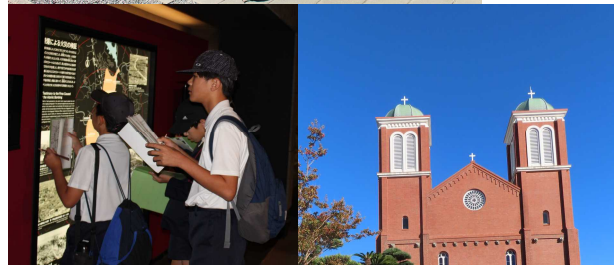
原爆のおそろしさと平和の大切さを学びました