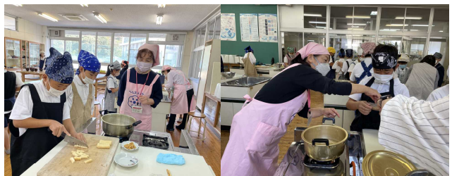
5年生の調理実習(みそ汁づくり)を食改グループの方々手伝っていただきました。