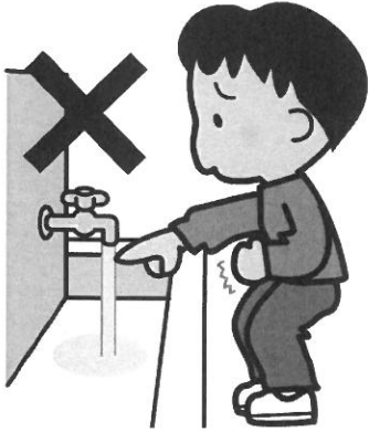
ゆびさき 指先だけあらったい…