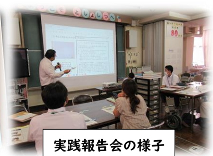
実践報告会の様子

実践報告会お世話になりました。お忙しい中、全員が実践記録をまとめていただきました。感謝申し上げます。「全員で研究ができる!」とうれしくなりました。協議や感想の中で、視点の統一や見栄えの話がありました。私たちは、「初めて見た人がどう思うか」「持続可能な研究か」も念頭に入れて研究を進めるのも大事だと思います。8月24日(木)までに加筆・修正を行い管理職に起案してOKをもらい、データの提出をお願いします。夏休み明けには掲示したいと思います。