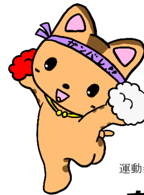
運動会マスコットキャラクター