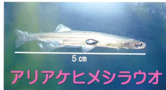
アリアケヒメシラウオ