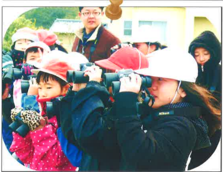
有明海でバードウォッチングをしました