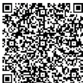
回答（振込確認）コード

（お願い）協賛金を入金される方へ ご入金後の振込確認を行うため に、左のQRコードにアクセスして、 情報提供のご協力をお願いします。