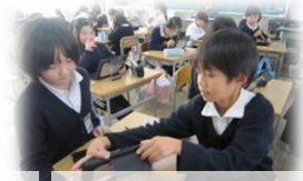
教え合いも自然に

新しい端末【iPad】が、腹赤小にやってきました。この端末では、撮影・録画、学習ドリルなど、これまでの端末よりも容易にでき、様々な作品を創ることができます。 まずは、冬休みにいろいろな機能に触れ、子どもたち自身が賢くなるための活用を行っていきましょう。1月からの学習では、積極的に活用していきます。