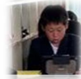
調べたことをもとに、自分の作品創りの参考に