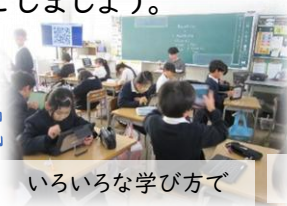
いろいろな学び方