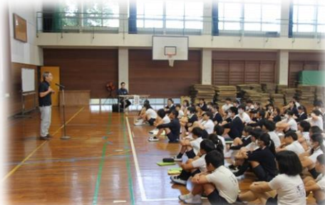
上野会長の趣旨説明

10月28日(木) 腹赤小学校の特色の1つである、学校運営協議会主催の地域の皆様との地域合同防災教室を行いました。当日は、ご多用のところ、多くの皆様に参加していただき、たいへんありがとうございました。