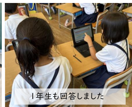
1年生も回答しました