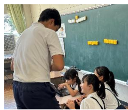
熱中症対策のため外で遊べないときは、学習ソフトを使って、1年生と6年生で活動していました

これまでの学校教育活動の振り返りとして、全校児童と保護者の皆様に、「学校アンケート」への回答をお願いしています。ロイロノートを使っての回答となります。昨日配付した文書をご確認いただくか、子どもたちから回答方法を聞かれて、ご回答をお願いします。よろしければ、7月31日までにご回答ください。保護者の皆様方からの声を基に、今後の教育活動に生かしていきたいと思ひます。ご多用のところたいへん恐れ入りますが、ご協力の程、どうぞよろしくお願いいたします。