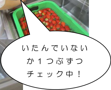
いたんでいない か1つ ひとつ ぶ ぶ ず ず つ チェッ ち ック く 中 ちゅう ！