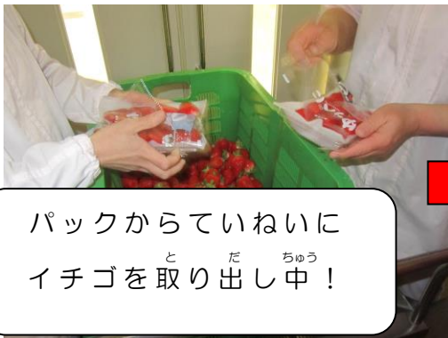
パックからていねいに イチゴ いちご を取り出し中 と ！