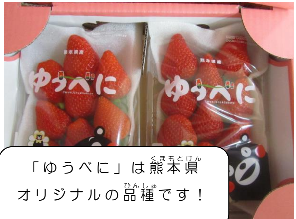
「ゆうべに」は熊本 くまもと 県 けん オリジナル ひんしゅ の品種 ひんしゅ です！