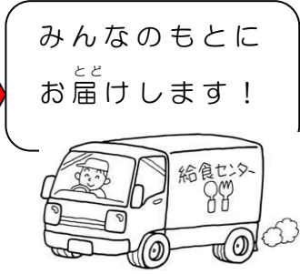
みんなのもとに お届 とど け け し し ま ま す！