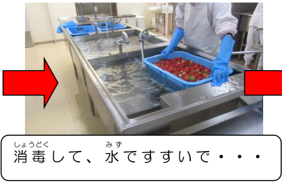
しょうどく しょうどく すす すす 消毒 しょうどく して、水 みず ですすいで・・・