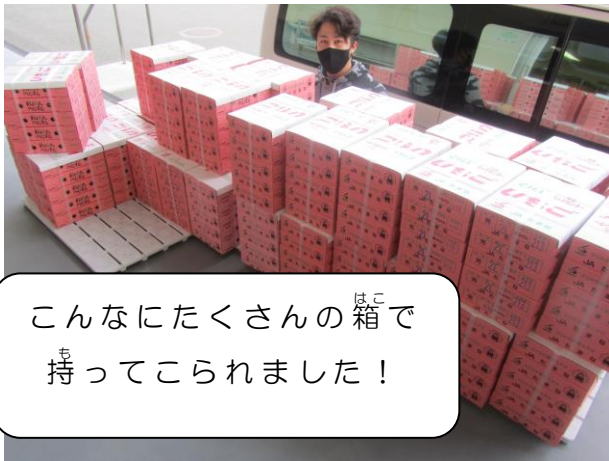
こんなにたくさんの箱 はこ で 持 も ってこられました！

こんだて ひょう 表でお知らせしたとおり、たまなし たまなしやさいしんこうきょう 野菜振興協 議会 ぎかい の方 かた 々のプレゼントで、たまなし たまなし の小 しょう 中 ちゅう 学 がっこう 校 がっこう のみなさん に食 た べていただくいちごが、きのう 3時 じ ごろたまな たまな 中央 ちゅうおう 学 がっこう 校 がっこう 給 きゅう 食 じょく センターにとどけられました！みなさんが今日 きょう 食 た べ ているのは、「ゆうべに」といういちごです。