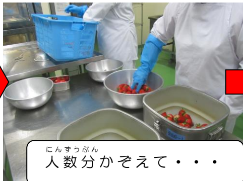
にんずう にんずう ぶん ぶん 人数 にんずう 分 ぶん か か ぞ ぞ え え て・・・