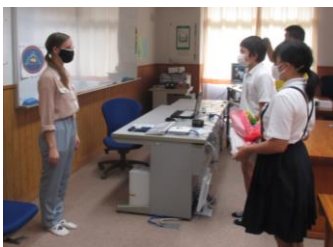
禅さん・さくらさんお礼の言葉