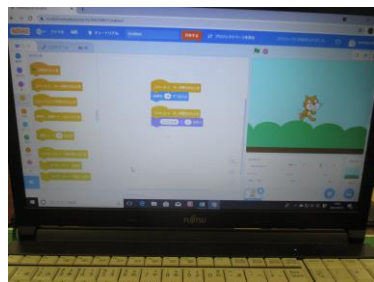
スクラッチでプログラミング作品

プログラミングしていき、スプライトを動かしたり変化させていきます。初めてやってみる児童がほとんどでしたが、すぐになれ、背景を変えたり、音や会話を入れたりという複雑なプログラミングも楽々とマスターしていました。タブレットに入っていますので、これからも続けていきます。