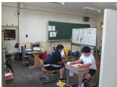
すぎのご教室の様子

先生方もいろいろな工夫をして授業に取り組んでいます。日奈久小から、冷房の入る空いている特別教室を借りることができることも感謝です。子供達の未来のために、八竜小・日奈久小の先生方が、今できることに全力で取り組んでいます。保護者の皆様ご安心ください。