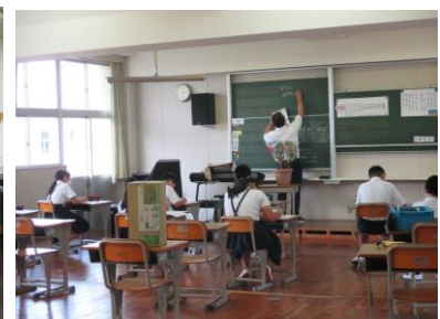
6年生教頭先生の理科の授業