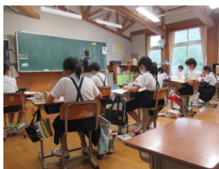
4年生国語の集中した授業

一学期は8月7日(金)までと、例年とは違う長さとなります。各教室等には冷房完備ですので、熱中症等にも気をつけながら、これからも子供達に「確かな学力」「豊かな心」「健やかな体」を育ていけるよう全職員で頑張ります。