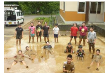
5・6年生「しろかき」後の一枚

これからも、子供達のがんばりを学校便りや学校HP https://es.higo.ed.jp/hachiryues/ で紹介します。是非ご覧ください。