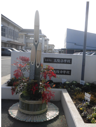
学校運営協議会の皆さん と中学校新生徒会作成