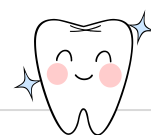
R6 むし歯治療完了状況12月18日現在

また、令和7年1月28日(火)に開催が予定されている、「令和6年度八代学校保健研究協議大会」では、「歯と口の健康」について、3名の講師の講話が予定(オンラインで視聴可)されています。学校の一室で視聴できるように準備しますので、ご希望される方は、ご来校ください。(詳細については、後日メールにてお知らせします。)