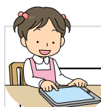
R6メディアコントロール週間項目別達成率

やがて冬休みが始まります。学校においては、1日の生活の計画やメディアコントロールについては、事前に指導しますので、ご家庭でも話題にいただき、子どもたちの自立に役立てていただければと思います。