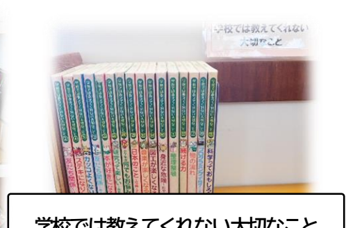
学校では教えてくれない大切なこと