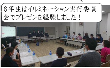
6年生はイルミネーション実行委員 会でプレゼンを経験しました！