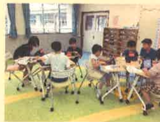
第5学年 総合的な学習の時間