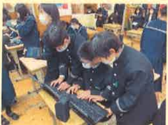
第1学年 総合的な学習の時間