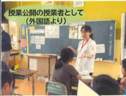
授業公開の授業者として (外国語より)

授業公開により、優れた授業技術が、他の教員に伝わり、授業づくりの一助となっています。