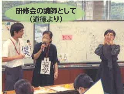
研修会の講師として (道徳より)

授業公開により、優れた授業技術が、他の教員に伝わり、授業づくりの一助となっています。