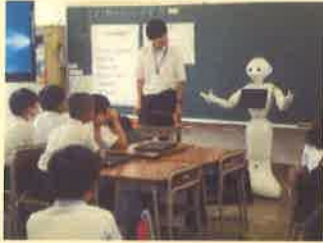
第3学年 総合的な学習の時間