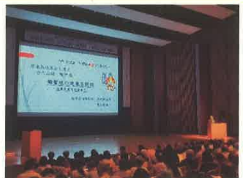
(鞠智城シンポジウムの様子)

5年ぶりの東京開催となった第17回鞠智城シンポジウム。今年は「渡来系技術と古代山城・鞠智城」をメインテーマに、全国からの研究者たちが鞠智城について報告及びパネルディスカッションを行いました。当日は800名を超えるみなさまにご参加いただきました。