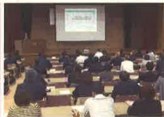
講義「校内における体制づくりと学習言語習得及び進路保障」の様子

日本語指導が必要な児童生徒の受入れ支援体制の充実に向けて実施しています。今年度は、11月2日に県内の市町村教育委員会関係者及び関係小・中学校等の担当者を対象に講義や協議を行い、日本語指導に関する理解を深めました。