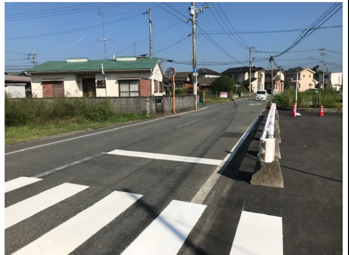
カーブから 突然見える 自動車が