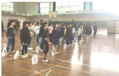
【「ありがとうの花」歌唱】