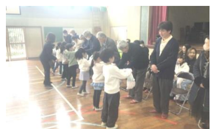
【お花のプレゼント】