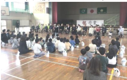
【ボランティアのみなさま】

3月1日（土）、授業参観に先がけて「ありがとう集会」を開催しました。本校は、登下校の見守りや読み聞かせ、授業支援、そして本物体験などでたくさんの地域のみなさま、保護者のみなさまにお世話になっています。そのお礼の気持ちを伝える集会です。今年お世話になったみなさまをご招待し、感謝の気持ちを言葉や歌やプレゼントで伝えることができたかなと思います。今年一年本当にお世話になりました。そして、来年度もどうぞよろしくお願いいたします！