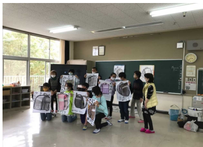
3/9:6年生の絵手紙教室

来年度は、コロナ禍とうまく工夫して付き合いながら、日頃の学校生活に加えて、盛りだくさんの大きな行事を通して、子供たちの成長につないでいきたいと考えます。