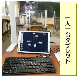
一人一台タブレット