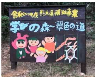
5年生制作の新看板