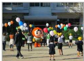
風船飛ばしはこんな感じ？

大きな行事だけでも、このような感じです。コロナ禍の影響次第ではありますが、お心づもりとご支援をよろしくお願いします。