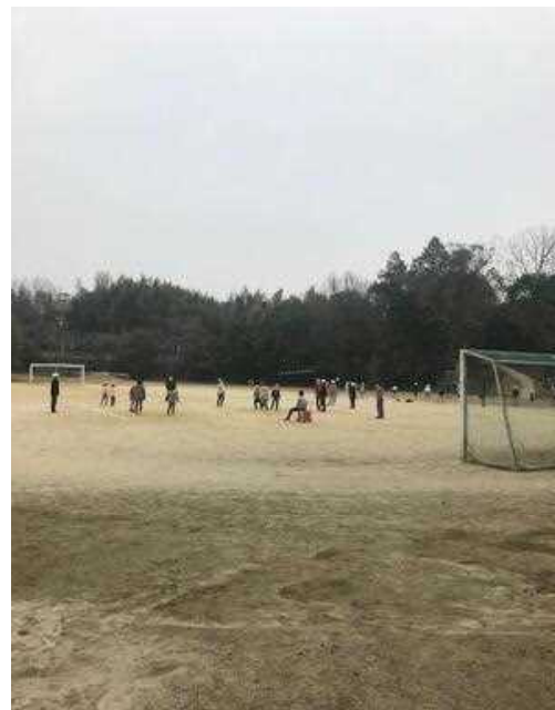
コロナに負けず、寒さに負けず外遊び