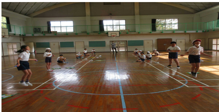
なわとび大会も学年ごとに実施となりました。

学校行事も 縮小 しゆくしょう 、中止 ちゆうし 、延期 えんき などを余儀なくされています。なかでも6年生の修学旅行については、再々 えんき 延期となってしまいました。3月にはなんとか形を変えてでも実施できればと考えています。