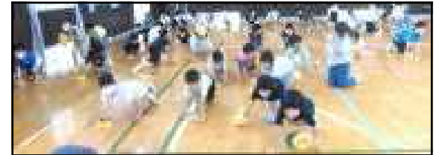
「ハイハイ鬼ごっこ」の様子

児童会の体育委員会児童が企画した「ハイハイ鬼ごっこ」が開催されました。目的は、1年生から6年生までが、楽しみながら体力向上を図ることでした。みんな、本当に楽しそうでした。