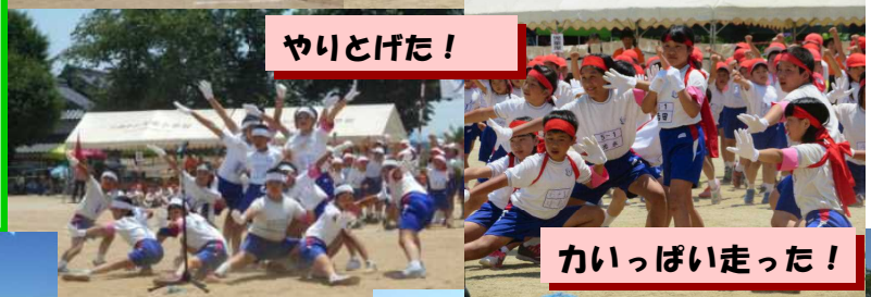
かいっぱい走った！