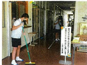
早朝ボランティア