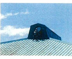
体育館屋根の修理

二つ目は、発表です。わたしは、手をあげて発表することが苦手でした。でも、三年生になって少しずつ自信を持って発表することができるようになっています。授業参観では、お母さんの前で発表する姿を見ることができました。きんちょうしたけど、手をあげて発表することができてよかったなと、うれしい気持ちになりました。