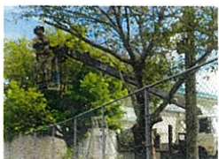
樹木の剪定 体育倉庫周辺

横断歩道(カラー歩道)が変わりました。白石十三部の上妻石材近くの横断歩道が、カラー歩道になりました。これは、白石十三部の区長の方々が山鹿市や警察署に熱心に要望を上げていただいたおかげです。信号機の設定を要望していただき、道幅等の関係で難しいそうでしたが、断旗がつくことになりました。