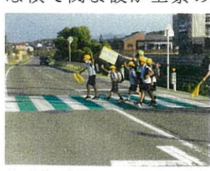
カラー歩道を渡る子どもたち

横断歩道(カラー歩道)が変わりました。白石十三部の上妻石材近くの横断歩道が、カラー歩道になりました。これは、白石十三部の区長の方々が山鹿市や警察署に熱心に要望を上げていただいたおかげです。信号機の設定を要望していただき、道幅等の関係で難しいそうでしたが、断旗がつくことになりました。