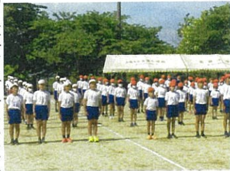
「やる気」伝わる整列

いよいよ運動会が近づき、子どもたちの練習も熱気を帯びてきました。開閉会式練習や応援団、ダンス、団体競技の練習も、子どもたちの気持ちの高まりと同じように、表現力も高まってきています。子どもたちのこれまで暑さに負けず、毎日の練習に耐え成長した姿をご覧ください。保護者の皆様の運動会へのご来校をお待ちしております。また、ご家族の人数を二人としましたので、リモートで運動会の様子を配信いたします。ご利用よろしくお願いたします。