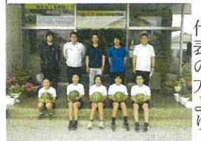
生産者の方々と子どもたち

二十五日（水）にJA鹿本園芸部の皆さんから、スイカをいただきました。このスイカのプレゼントは、子どもたちにも山鹿・鹿本地域が、スイカの特産地であることを知ってもらい、スイカに親しむ生産地としての誇りをもってもらおうことを目的に、五十年以上続けられている取り組みです。給食委員会の六年生が代表して、受け取ってくれました。代表の方より「山鹿市でとれたスイカです。私たちが一生懸命つくりました。スイカを食べると、元気がいっぱい下さいます。運動会も応援し、スイカをいただきました。」という言葉をいただきました。