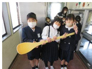
給食調理室見学 (1/27 2年生といっしょに)