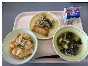
特別メニューによる給食 (※1/26 韓国料理)