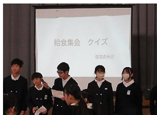
健康委員会による全校集会 「給食クイズ集会」

この期間、以下のような取組を行っています。家庭でも「給食」についてぜひ話題にしてみてください。