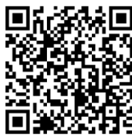
スマホ・ネット安全教室 for family