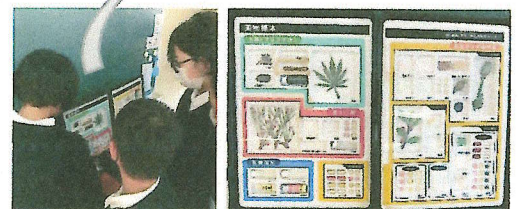
↑ 麻薬や覚せい剤などの見本

自分の身近で大切な人に、学んだことを教えたいという感想を持った人がたくさんいました。「電子タバコは大丈夫ですか？」と心配して質問する人もいました。