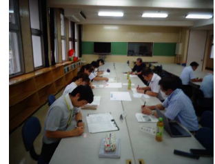
児童の良さを出し合いました