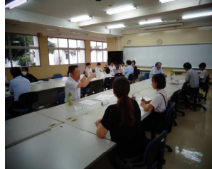
アドバイスを受ける代表児童

10月3日(木)、第3回の学校運営協議会を実施しました。前半は、各委員会の代表児童が学校運営協議会委員の皆様へ活動する上での悩みを相談し、それに対してアドバイスを受けました。児童は「何かもやもやしたものがすっきりした」、「アドバイスいただいたことをやってみよう」などの感想を話してくれました。後半は、職員と協議会委員の皆様で「中央小児童のいいところと課題」を出し合いました。出された意見は共通する点も多く、次回の協議会で課題解決への熟議を行う予定です。