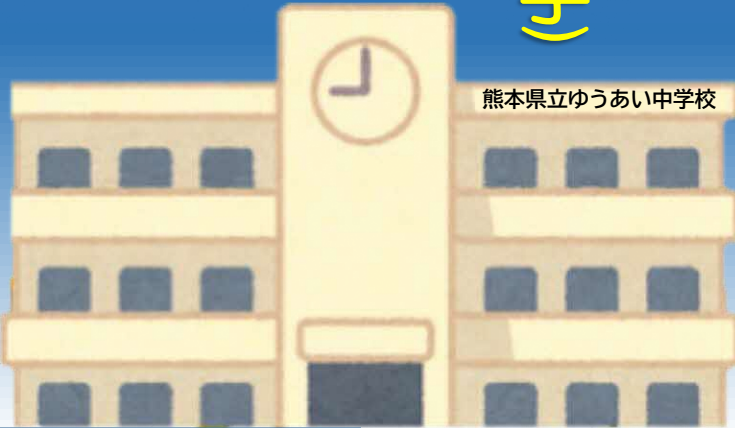
熊本県立ゆうあい中学校

くまもとけんりつ 熊本県立 ゆうしんかんこうとうがっこう 湧心館高等学校 くまもとしちゅうおうくいずみ (熊本市中央区出水) しきちない かいこう 敷地内に開校