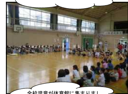
全校児童が体育館に集まりました。3年半ぶりのことです。低学年の子どもたちも感想を発表しました。