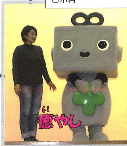
マスコットキャラクター ロボ君