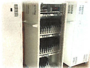
タブレットPC充電保管庫