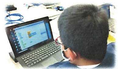
6年生のプログラミング学習

国のGIGAスクール構想を受け、一月から本校でも、一人一台のタブレットPCが使用できる環境が整いました。