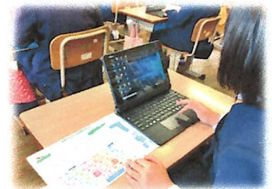
3年生の学習の様子