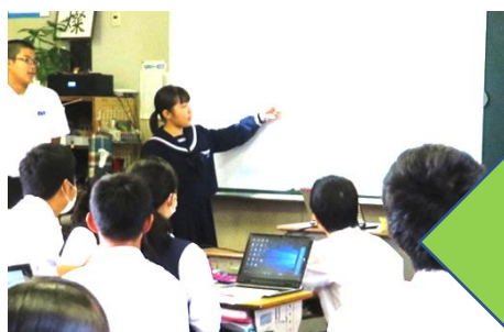
＜発表や話し合い＞ グループや学級全体での発表・話し合い