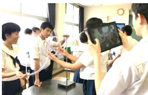
＜調査活動＞ インターネットを用いた情報収集、写真や動画等による記録

文部科学省のGIGAスクール構想によるタブレットパソコンの子供1人1台環境は、これからの時代を生きていく子供たちが確かな学力を身に付けることができるように、そして、コロナ禍においても学習活動を円滑に実施できるようにという考えから進められているものです。八代市においても、1月から本格導入できるように順次環境整備を進めてきました。これから1人1台端末を有効活用し、よりよい学習になるよう取り組んでいきます。