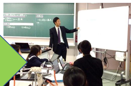
＜教師による教材の提示＞ 画像の拡大提示や書き込み、音声、動画などの活用