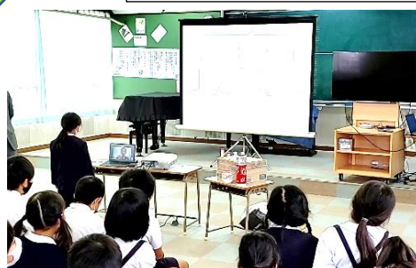
＜遠隔地との交流＞ 交流校や社会科見学先等の遠隔地との交流学习

※ICTとは、通信技術を使って人とインターネット、人と人がつながる技術のことです。