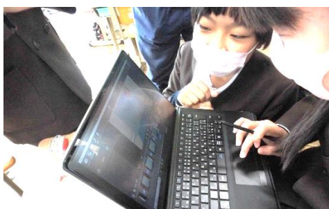
＜協働での意見整理＞ 多様な意見・考えを議論して整理