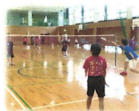
バドミントン クラブ

各スポーツ競技を通して、体力の向上と豊かな人間性の育成を図っています。各クラブをご指導していただく保護者・地域の皆様には、大変お世話になっております。これからも、文政っ子のために、ご指導・ご支援をよろしく願います。