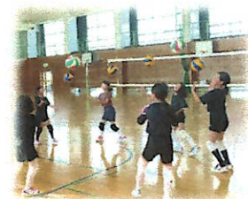
バレーボール クラブ