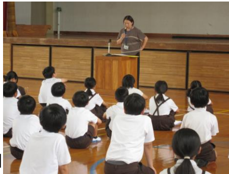
【全児童が、真剣に聴いて 考えてくれました】