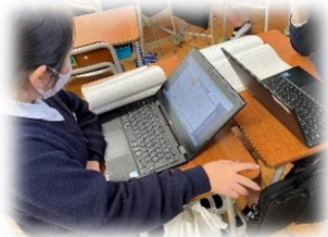
高学年でのICT活用の様子 <大津町立美咲野小学校>

この度、大津町教育委員会が学校情報化「先進地域」に認定(R4.10.19)されました。