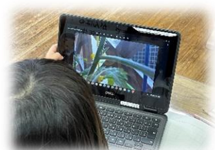
低学年でのICT活用の様子 <水上村立岩野小学校>

この度、水上村教育委員会が学校情報化「先進地域」に認定(R4.10.19)されました。