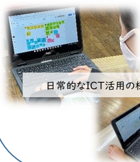
日常的なICT活用の様子

全ての小中学校での学校情報化「優良校」の認定取得、教員のニーズに応じたコース別の研修会の実施、大学との連携授業、オンライン英会話の実施、小中学校が相互に連携をとる体制等が評価されました。