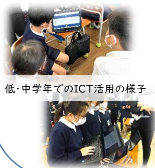
低・中学年でのICT活用の様子

全ての小中学校での学校情報化「優良校」の認定取得、ICT活用指導力向上研修、デジタル教科書活用指導力向上研修、ステップアップ研修等、教職員の指導力向上に関する様々な取組が評価されました。