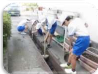
災害復旧クリーン作戦の様子