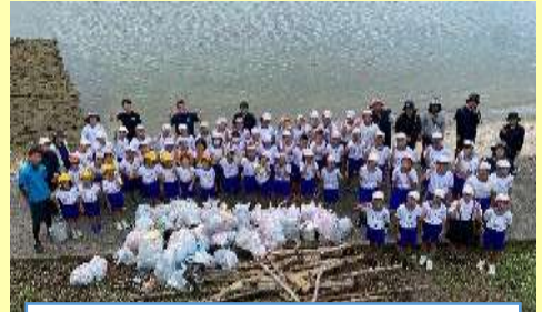
昨年度のビーチクリーン大作戦