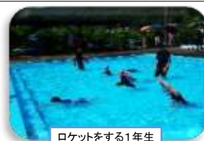
ロケットをする1年生

複数学年で実施したことで、他の学年の児童の泳ぎを見て、来年に向けて「もっとがんばろう」「上手に泳げるようになりたい」という思いをもったのではないのでしょうか。