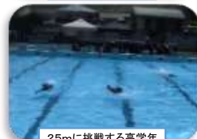
25mに挑戦する高学年