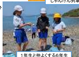
1年生と仲よくする6年生