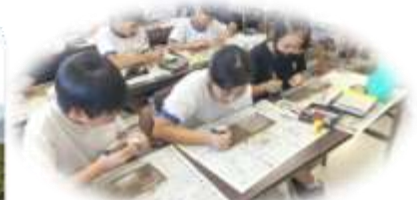
思い出をつめこんだ 焼き杉フォトフレーム