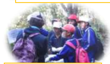
友達のよさを感じた スコアオリエンテーリング