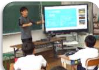
スポーツ指導 田上 様

4～6年生は、「身近な職業についての話を聞き、仕事に関する関心を高めること」「自分の夢実現のためには、何が必要なのかを見つけること」をめあてに講話を聞きました。介護士、観光業、スポーツ指導の方の中からお一人と、地域おこしコーディネーターで阿村出身の太田弘樹さんの話を聞き、将来の職業について関心を高めていました。