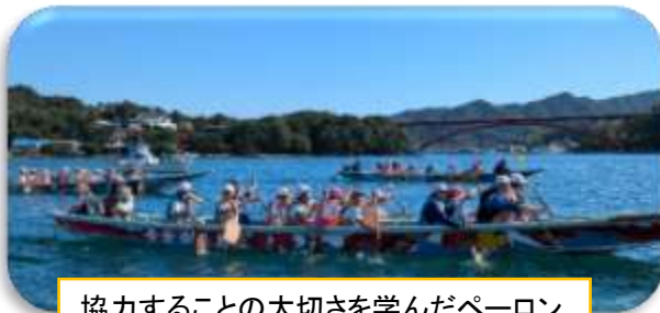
協力することの大切さを学んだペーロン

5年生は、11月7日～8日が集団宿泊教室でした。天気に恵まれ、ペーロン、スコアオリエンテーリング等、松島の自然のすばらしさに触れることができ、充実した時間を過ごしました。今津小と教良木小と連合での集団宿泊でしたが、最初は緊張していた子どもも徐々に打ち解け、自然と仲良くなったようでした。班の友達と声を掛け合い、励まし合うことで、協力することの大切さを学ぶとともに、コミュニケーション力を高めた2日間になりました。また、時間を守り、自分のことは自分でする2日間でしたので「自立」と「自律」の力も高めることができました。