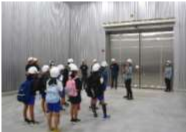
コンテナターミナル倉庫の見学

①八代港コンテナターミナル見学、②船外機工場見学、③くまモンポート八代で昼食、④造船所見学、⑤海運組合の出前講座、帰りは二号橋三号橋、五号橋の下を船で通って、大きな橋を下から見上げて楽しみました。海運組合の皆様、貴重な体験活動をご提供いただき、ありがとうございました。