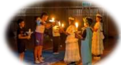
自分を見つめたキャンドルのつどい