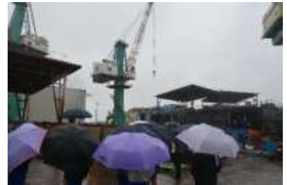
造船所クレーン等の見学