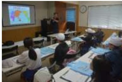
海運組合出前講座