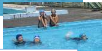
ワニさん歩きの1・2年生