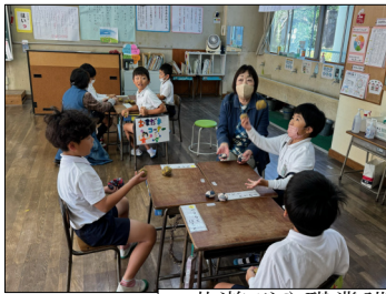
昔遊びや職業講話の様子より