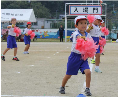
低学年「レッツ・ダンシング」

保護者の皆さま、地域の方々には、ご理解とご協力をいただきましたことを心よりお礼申し上げます。