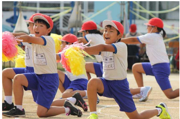
中学年「Mela!メラの思いを込めて魅せる新時代！」