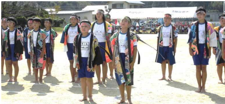
高学年「一致団結 ～AMURA ソーラン2022～」