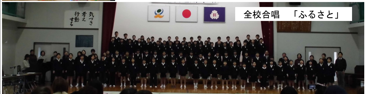
全校合唱 「ふるさと」