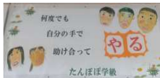
たんぼぼ学級の学級目標