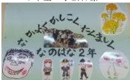
なのはな学級の学級目標