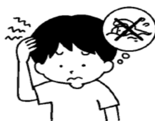
体調が悪いときは無理をしない