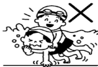
水の中や近くでふざけない