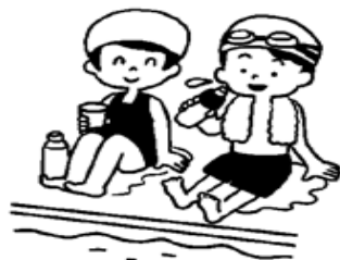
時間を決めて休けいをとる