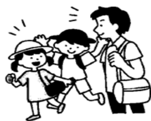
子どもだけで遊びに行かない

この時季、とくに注意したいのが水の事故。そのおもな原因のひとつに『不注意』があげられます。海や川、プールなどで遊ぶときには、ルールを守ることによる事故の「予防」がかかせません！