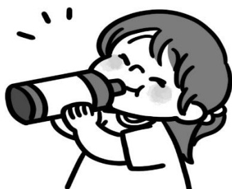
水分はとったかな？