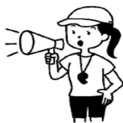
おうちの人や係員さんの指示を守る