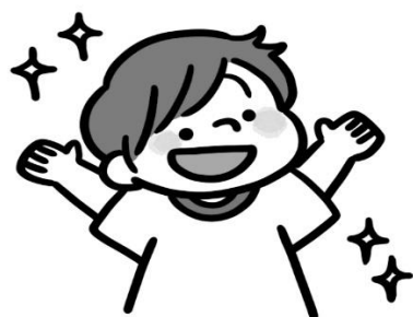
体調は問題ないかな？