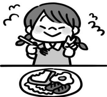
朝ごはんは食べたかな？