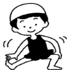
しっかりじゅんぴ運動をする