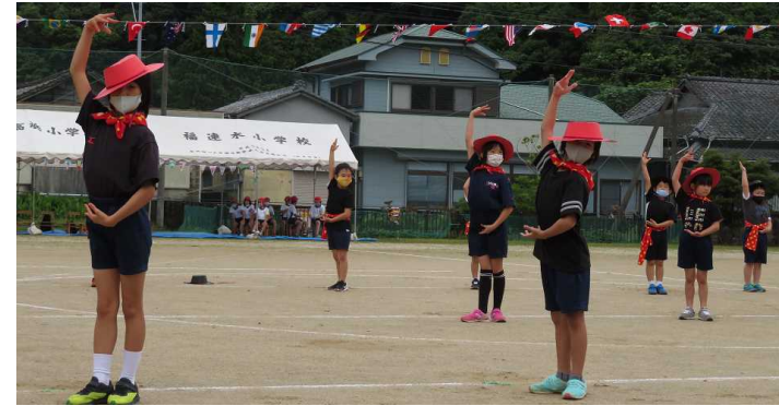
低学年表現「カルメン&ハピネスR3」