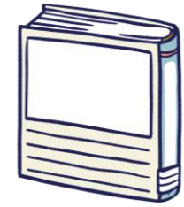
「それでもがんばる!」 どんまいないきもの図鑑DX 今泉忠明：監修 宝島社：出版