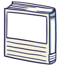
「春はあけぼの」 清少納言：著・文 ほるぶ出版：出版