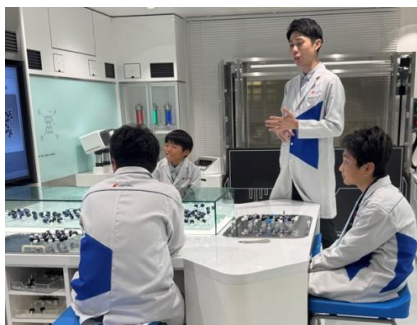
第2日目：職業体験活動の様子