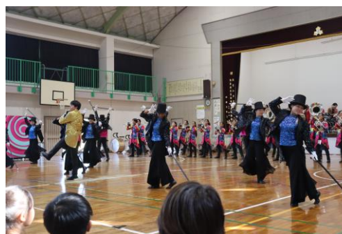
スクールコンサートの様子

12月16日（火）には、平和大使であり、本校卒業生（玉名高校1年生）を招いて、平和大使の活動や平和への思いを語ってもらいます。