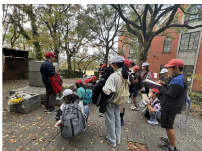
第1日目：平和学習の様子